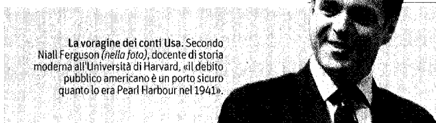
La voragine dei conti Usa. Secondo Niall Ferguson (nella foto), docente di storia moderna all'Università di Harvard, «il debito pubblico americano è un porto sicuro quanto lo era Pearl Harbour nel 1941».

Fuorviante. Usare il Pil come pietra di paragone è utile e logicamente rigoroso solo per il deficit dello stato